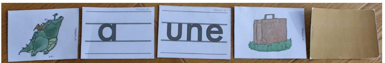
Smol a une valise brune