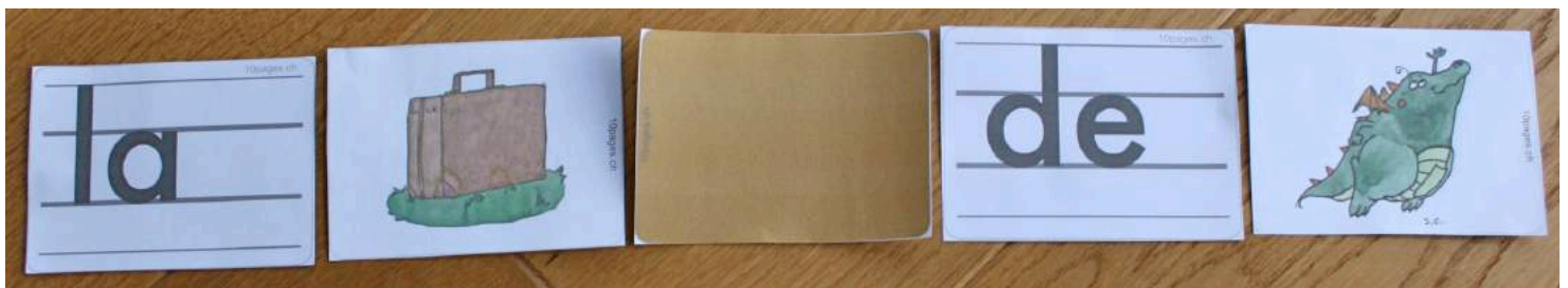
La valise brune de Smol