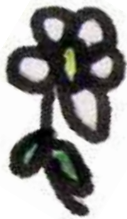
Illustration tirée du livre «La famille» ©2011